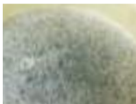
一晩寝かせ味をなじませたみりんと出汁