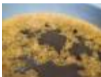
三原屋製の桶火入れ醤油