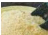
精製度が低く和菓子にも使われる三温糖